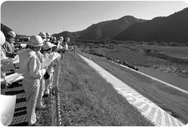
千曲川堤防護岸復旧工事（金井右岸）

昨年10月20日（火）総務産業常任委員会は、閉会中調査として、台風19号千曲川堤防災復旧現場、新工業団地建設予定地、A09号・インター先線工事現場等の調査を行った。