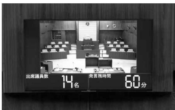
55インチ液晶モニター