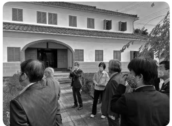
教育にかける心意気（格致学校）

昨年11月4日（水）社会文教常任委員会は、閉会中調査として当町の歴史・地理的位置を概観するべく左記の3施設を訪れた。 (一)文化財センター（石器・縄文〜室町時代） (二)坂本宿ふるさと歴史館（戦国〜江戸時代） (三)格致学校歴史民俗資料館（明治時代） 整理の行き届いた文化財センターの埋蔵物から、現在より遙に温暖であった石器時代から縄文時代にかけて和平でも人びとの暮らしがあったことが知られる。展示の中では全国的に特異な環状祭祀遺跡「青木下遺跡」が