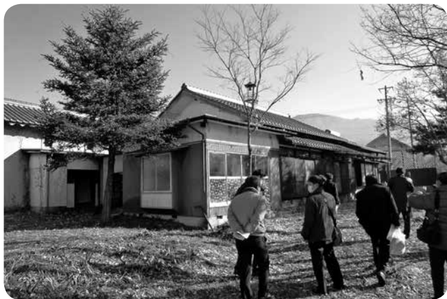
町が取得した鉄の展示館の西側隣接地を視察

坂城駅周辺活性化特別委員会は、昨年12月23日（水）10月に町が取得した土地及び建物を担当課立会いのもと視察を行った。場所は、鉄の展示館西側に位置し、敷地面積は1390・21㎡である。