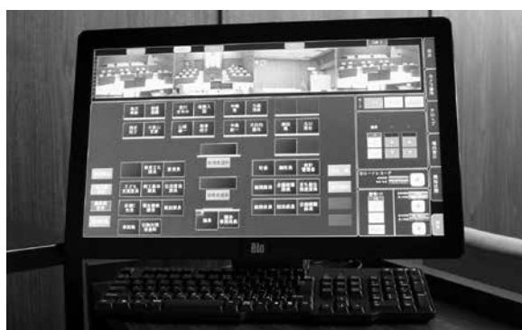
タッチ式議会中継システム