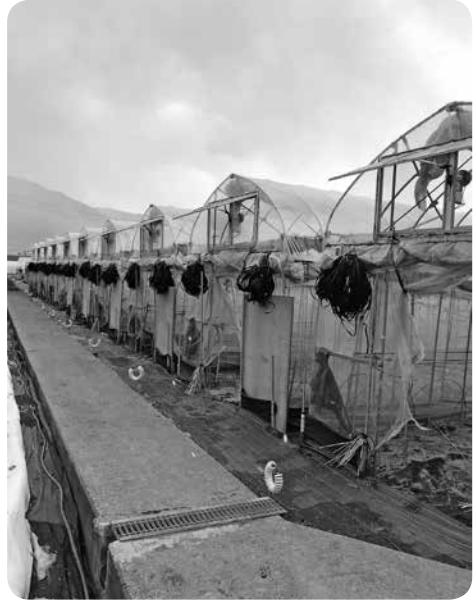
「特色ある地域農業」を目指して

問 農業の現状からの問題点や課題は何か。「特色ある地域農業」が推進されようとしているが、どのように農業振興を図っていくのか。 農業者の現状からの問題点や課題は何か。「特色ある地域農業」が推進されようとしているが、どのように農業振興を図っていくのか。