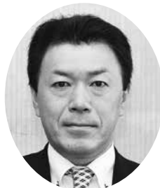
大日向 進也 議員

型交通なども視野に入れ新しい地域公共交通システム導入について検討を行っている。それを踏まえて運行形態、受付システム、コストなど様々な面について、町内の地域公共交通事業者と何度か話し合いの場を設けている。