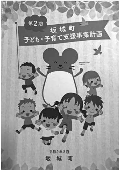
坂城の子は坂城で育てる

支援に加え、幼・保・小・中・高の連携を図り、個々が必要とする様々な支援を行う体制を整え、インクルーシブ教育を推進している。