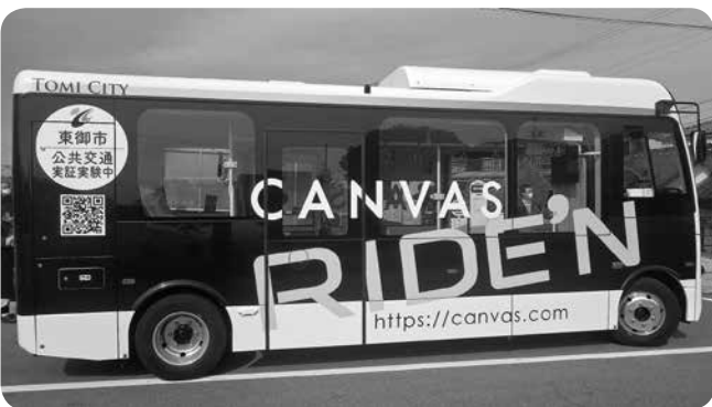
官民連携の電気バス（東御市）

問 昨年12月議会の町長答弁の中で、「デマンドを取り入れた手法も考えられ新たな運行業者との対話を持った」とあったが、どの様な業者と話をし、この一年でどう検討したのか。町長 昨年度から、循環バスと併用したデマンド