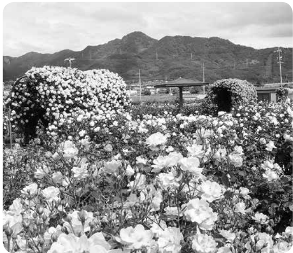
バラ公園名物 薔薇のトンネル

住民環境課長 「スピード落とせ」といった啓発用の旗を付近に配置し、運転者への注意喚起を図っていく。