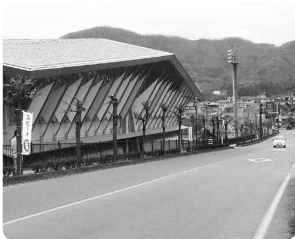
運転手さん、スピード落として！

問 新型コロナウイルス感染症への町の対応と事業所への支援策は。 福祉健康課長 町では、2月27日に町長を本部長に新型コロナウイルス対策本部を設置。状況の変化に応じて随時本部会議や連絡会議を開催している。町のホームページに感染症関連情報のコーナーを設け、相談先や中止・延期となった行事一覧などをまとめて掲載し、情報を常に更新し