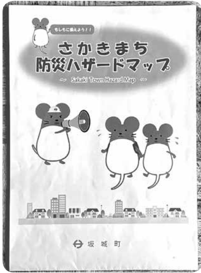
水害時、立ち退き避難の地域ごとの判断基準がわかります

問 昨年、発令された際、屋内安全確保の待避も避難行動であるが、町長 避難勧告は、避難の立ち退きを進め促すことである。