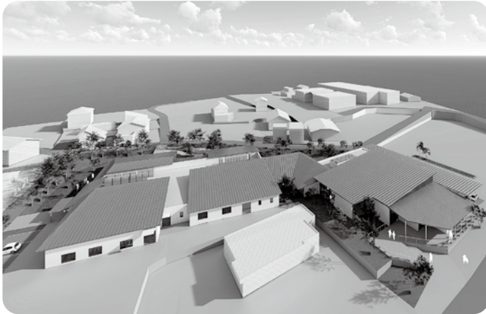
10月より着工 新複合施設（立体図）