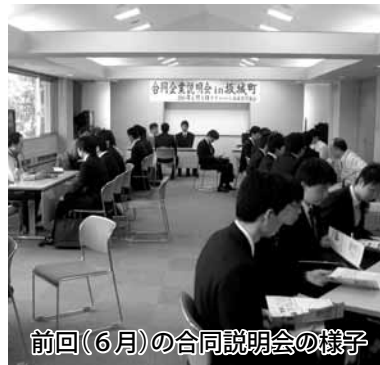
前回(6月)の合同説明会の様子