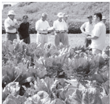
▼ケールのほ場巡回

この20世紀からの贈り物を21世紀の町産業の活性化につながる拠点と位置づけ、信州大学、