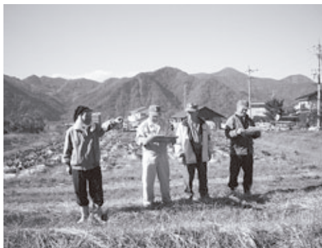
▲農業委員によるパトロール

その結果として、道が狭く農作業車・機械の乗り入れが難しいところ・住宅地に隣接した畑などが遊休化する傾向にあるこ