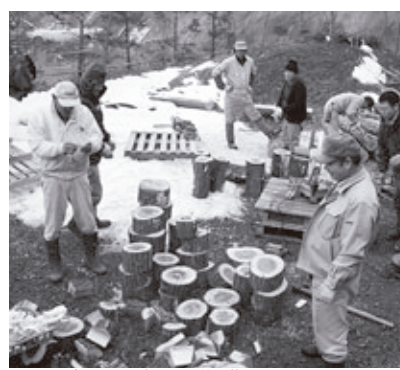
▲原木の玉切り作業

また、今後、農業経営に関する国の施策は、認定農業者等の担い手に集中的・重点的に実施することとされました。 農業の担い手として、また、自らの経営状況改善のため、認定農業者を目指してみませんか。