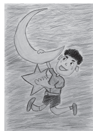
▲2025年ポスター 応募作品

②2月2日（月）午後1時～15日（日）千曲市役所1階カレリア 内容 個人作品・団体作品・共同作品の展示（両会場とも同じ内容の展示です。） ◎問い合わせ先 千曲・坂城障がい者（児）基幹相談支援センター ☎026127510548 坂城町では、2024年10月に、ポーランド日本国大使館で、坂城町とツェレスティヌフ郡及び坂城町国際交流協会とツェレスティヌフ郡国際交流協会の4者による「フレンド