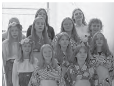
◀シベリア孤児記念小学校訪問時の児童による出迎いの様子

町では、坂城町国際交流協会を主体として、ポーランドワルシャワ日本語学校のサマースクールの生徒受け入れを2014年から実施しており、町民まつり坂城どんどんへの参加やワーキングホリデーに対する支援を行うなど親交を深めてきました。2019年にはワルシャワ日本語学校の仲介により、ツェレスティヌフ郡と同国際交流協会からの相互交流に向けた親書を受け、今回の協定締結に至りました。