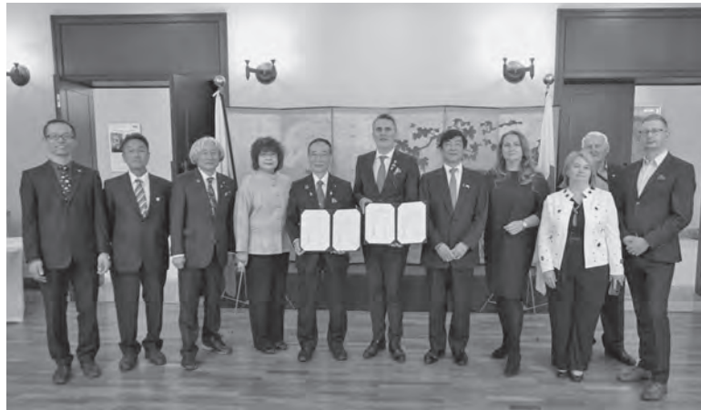
▲在ポーランド日本国大使館にて 調印締結後の記念撮影

10月9日(水)から6日間の日程で、町と坂城町議会、坂城町国際交流協会の代表者がポーランドを訪問し、11日(金)、在ポーランド日本国大使館で、坂城町とツェレスティヌフ郡および坂城町国際交流協会とツェレスティヌフ郡国際交流協会の4者による「フレンドシップ協定に関する合意書」を締結しました。今後、4者による友好的な親善関係の促進を図り、ツェレスティヌフ郡とのさまざまな分野における相互協力と連携支援、交流を通じた相互発展につなげていきます。