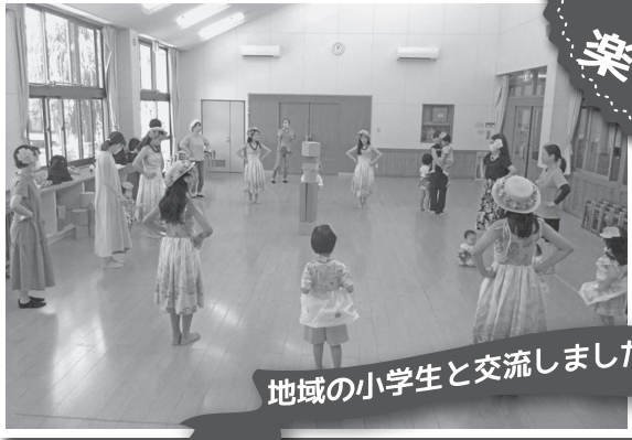
地域の小学生と交流しました