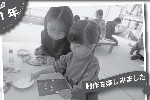
制作を楽しみました