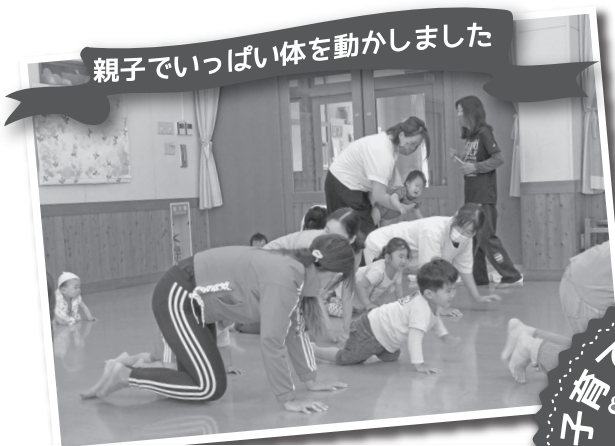
親子でいっぱい体を動かしました

いづれの行事にも事前の予約をお願いします。なお、行事の内容は変更する場合がありますので、あらかじめご了承ください。支援センター便り「すくすくひろば」でのお申込み、または支援センターに電話（☎82-2291）でお申込みください。