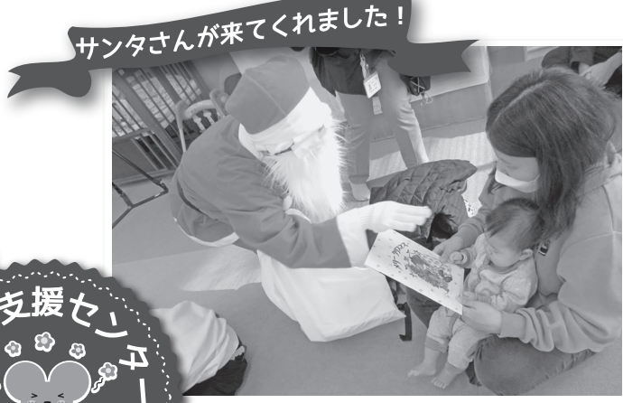
サンタさんが来てくれました！