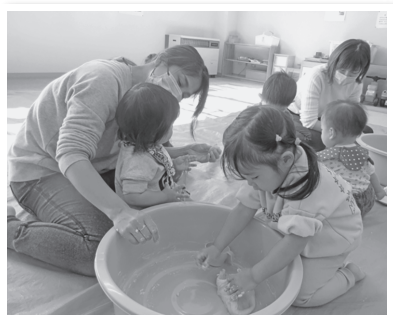
小麦粉粘土あそび

いずれの行事にも事前の予約をお願いします。 支援センター便り「すくすくひろば」でのお申込み、または支援センターに電話(☎82-2291)でお申込みください。