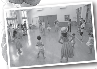
～一緒にフラダンス～