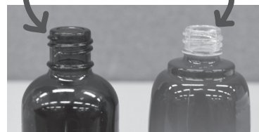
口が透明なので透明のびん