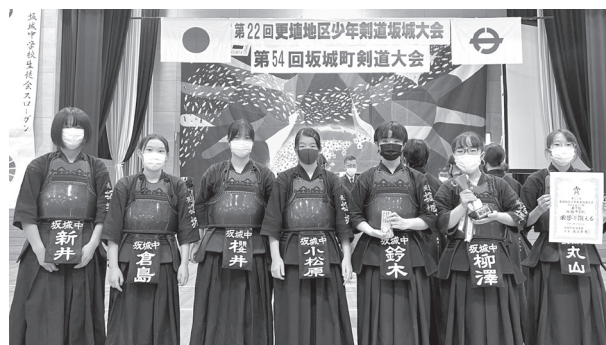
▲団体戦優勝の坂城中女子

10月23日(日)、坂城中学校で第22回更埴地区少年剣道坂城大会が開催されました。