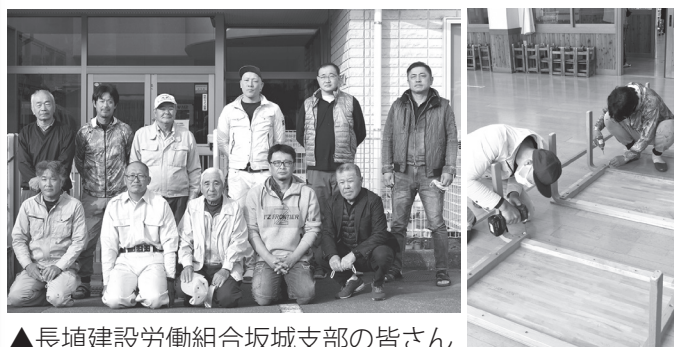
▲長埴建設労働組合坂城支部の皆さん

10月23日(日)、町内の3保育園で、長埴建設労働組合による奉仕活動が行われました。