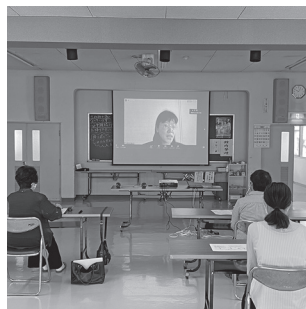
▲オンライン研修の様子

分の身に異変を感じた場合には迷わず、お近くの市町村、家庭裁判所、弁護士会等にご相談して下さい。人生毎日の生活の中で何が起きるか分かりません。多少なりとも前文の様な知識を知っておくことも無駄なことではないと思います。