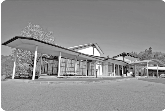
リニューアル工事を待つびんぐし湯さん館