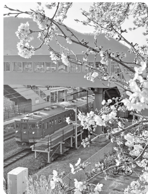
しなの鉄道テクノさかき駅

被保険者から保険料を徴収し、制度運営主体である後期高齢者医療広域連合へ納付する。前年度比0・1%、16万円の減。