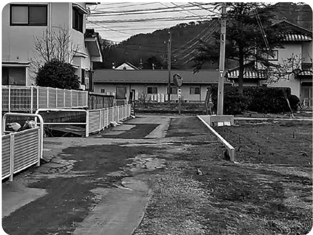
道路拡幅工事現場（新地）