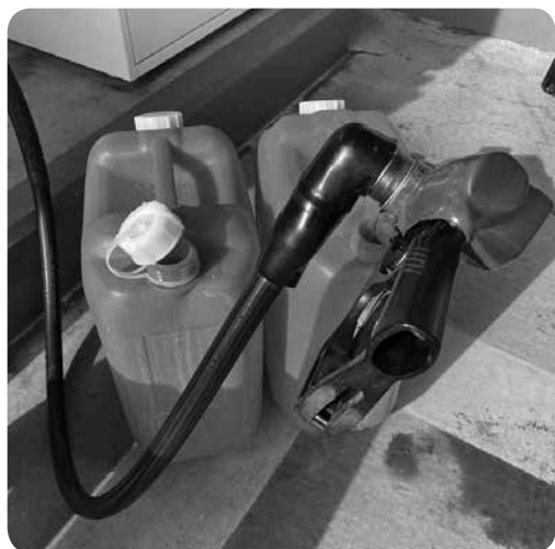
当町も支援開始へ

教育文化課長 交差点改良やカラー舗装、舗装の修繕が必要なハード面が13箇所。通学路変更を検討するソフト面が1箇所。ハード面のうち7箇所は整備完了までの応急対策として注意喚起の「のぼり旗」を設置、4箇所は地域ボランティアや学校職員による見守り活動を行う。