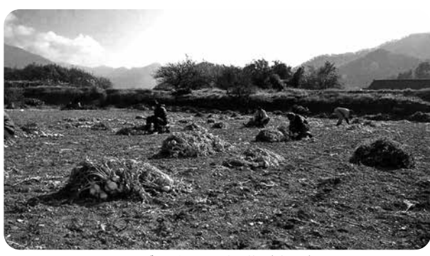
ねずみ大根の収穫（上平）

改善や気象変動に対する対応力のある新品種の育成等による産地体質の強化策など、変化に適切していく技術開発が必要と考える。国や県では、気候変動による農業生産への影響が顕在化する中で、農産物の安定供給に向けた対策を実施するために各試験場での品種改良や栽培技術の研究を進めている。また、JAにおいても異常気象に対応できる栽培技術の改善・改良に取り組んでいる。