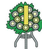
葬式の花輪・供花