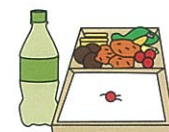
地域の運動会やスポーツ大会への 飲食物の差し入れ