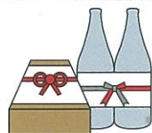
町内会の集会や旅行などの 催物への寸志や飲食物の差し入れ