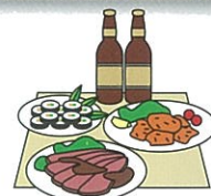
お祭りへの寄附や差し入れ